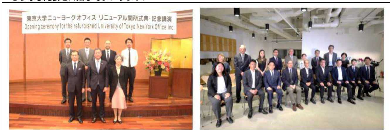
日本から(藤井総長他)

拠点として、今後積極的に利活用いただけるよう、さらなる発展を目指してまいります。